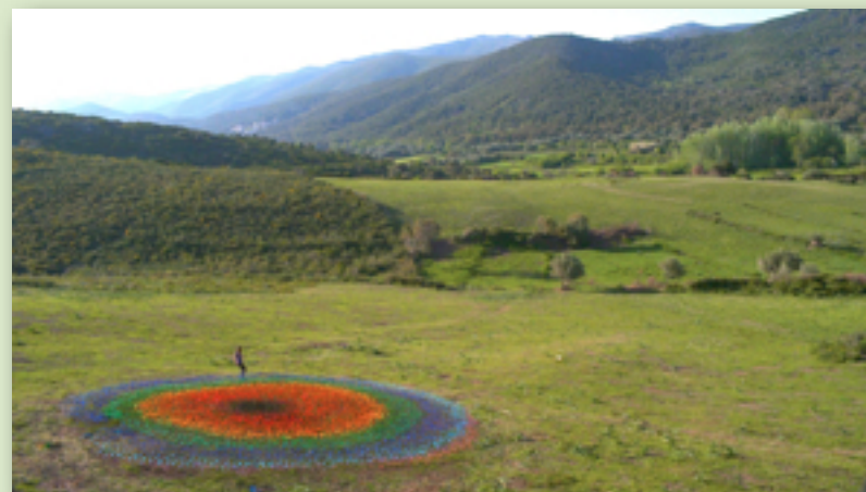
Arc-en-cible : route de Luri Cap Corse visible jusqu'au 1er novembre

La Corse est considérée principalement comme une île touristique aux paysages merveilleux, et aussi comme lieu de violence. Cette image réductrice peut évoluer grâce à la richesse d'une création artistique surprenante exposée à ciel ouvert. L'art est le seul langage assez riche pour permettre de donner forme à une pensée plurielle capable de conjuguer les contradictions et d'ouvrir sur des idées inédites et créatives.